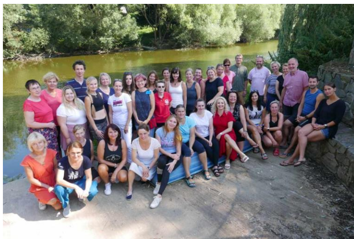
Letní škola pro učitele, Samechov