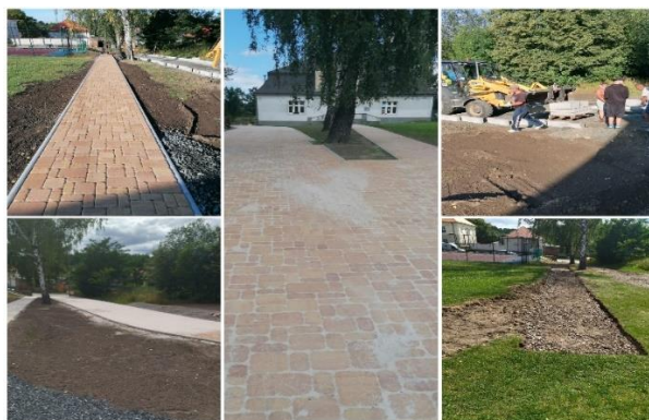
výstavba chodníku před ŠJ a ŠD