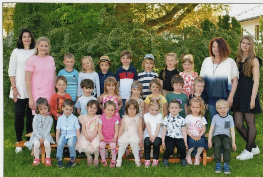
Mateřská škola Malešov 2022 - 2023 houbičky

V obou třídách naší školky plní téměř pravidelně svou praxi studentky ze SOŠPg Čáslav.