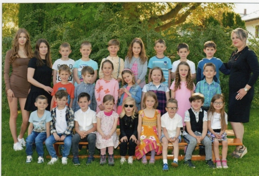
Mateřská škola Malešov 2022 - 2023 housenky